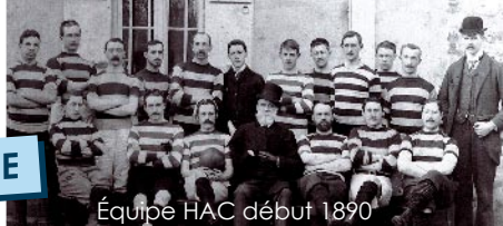
Équipe HAC début 1890