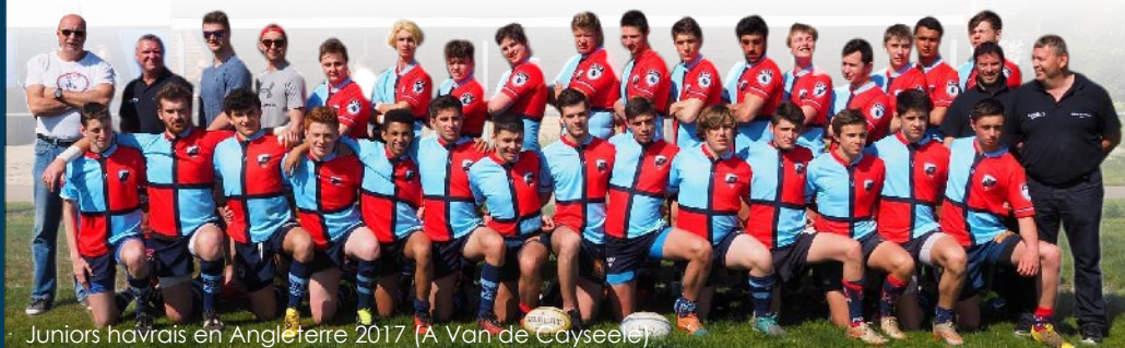
Juniors havrais en Angleterre 2017 (A Van de Cayseele)

Retrouvez les principaux jalons historiques du HAC rugby sur le site du club en flashant ce QR code