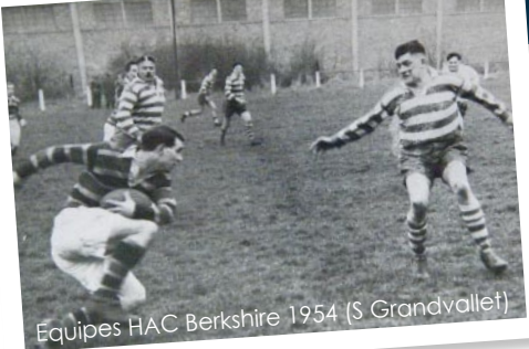
Equipes HAC Berkshire 1954 (S Grandvallet)

Retrouvez les principaux jalons historiques du HAC rugby sur le site du club en flashant ce QR code